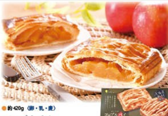
アップルパイ 2,770円(税込2,992円) 無凍 ㈱しらおい菓子工房まいこ

仁木町・鶴田農園産のりんごをバターソテーして、こだわりのパイ生地を包み、焼き上げました。アップルパイ好きにはたまらない贅沢な一品です。