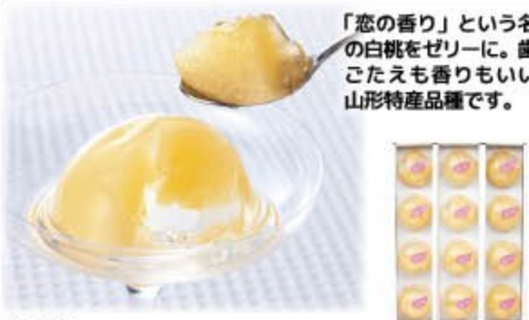
恋香桃ゼリー 2,500円(税込2,700円) 無 生活クラブスピリッツ㈱