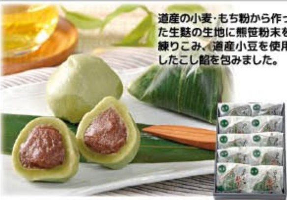
熊笹巻万頭 10個入り 2,780円(税込3,002円) 完凍 ㈱小山製菓所

道産の小麦・もち粉から作った生麩の生地に熊笹粉末を練りこみ、道産小豆を使用したこし餡を包み込みました。