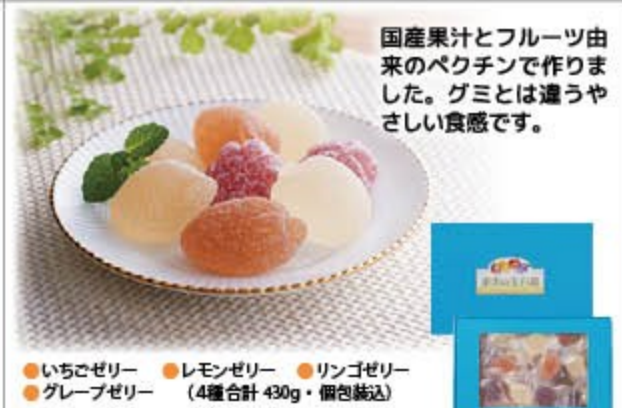
果実の宝石箱(一口ゼリー詰合せ) 1,850円(税込1,998円) 無 ㈱ミサワ食品