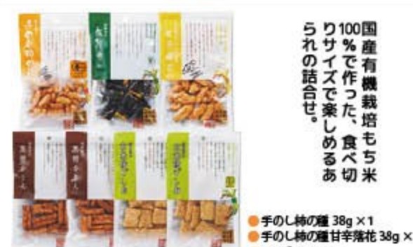
有機あられセット 2,200円(税込2,376円) 無 ㈱精華堂製菓本舗