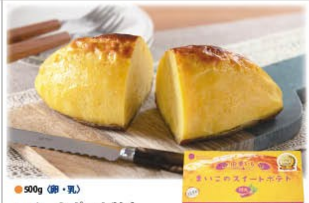
スイートポテト特大 2,000円(税込2,160円) 無凍 ㈱しらおい菓子工房まいこ

原材料の約70%がさつまいもという素材の味を活かしたスイートポテトです。道産さつまいもと無添加の生クリーム、バターをたっぷり使用し、じっくりと練り上げました。