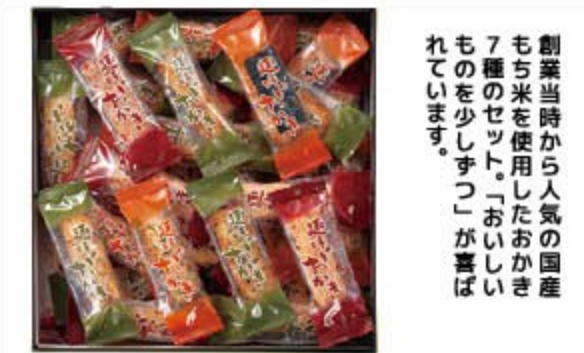
趣味のおかし 1,720円(税込1,858円) 無 ㈱精華堂製菓本舗

創業当時から人気の国産もち米を使用したおかし7種のセット。「おいしいものを少しずつ」が喜ばれています。