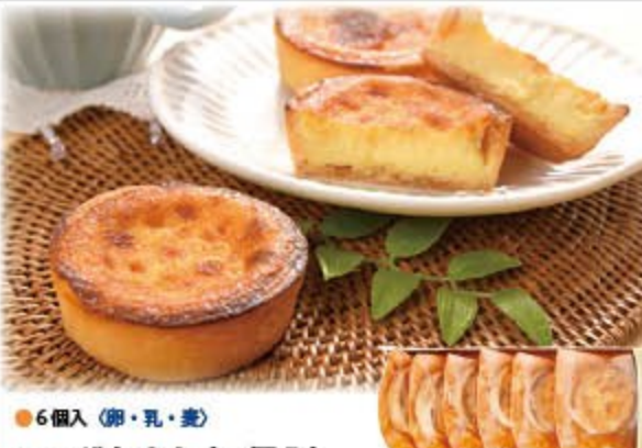
エッグタルト(6個入) 2,715円(税込2,932円) 無凍 ㈱しらおい菓子工房まいこ

白老産の卵と無添加の生クリーム、フロマージュブランをベースに濃厚ソースに仕上げ、手作りのタルト生地に入れて焼き上げました。