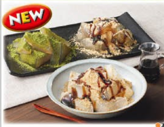
わらび餅・本葛入り葛餅詰合せ 2,430円(税込2,624円) 無 ㈱ミサワ食品

わらび餅の原料(砂糖、わらび粉、きな粉、黒糖、水飴)は国産原料を使用。葛餅は、吉野葛を配合し柔らかく弾力のあるのどごしの良い食感に仕上げています。