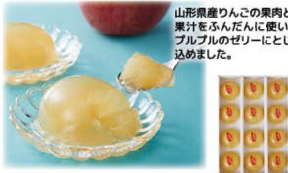
りんごゼリー 2,500円(税込2,700円) 無 生活クラブスピリッツ㈱