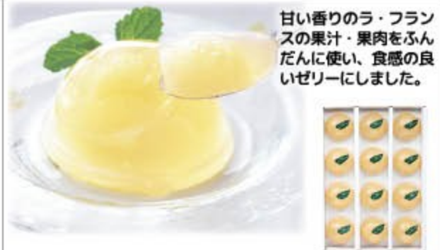
ラ・フランスゼリー 2,950円(税込3,186円) 無 生活クラブスピリッツ㈱

甘い香りのラ・フランスの果汁・果肉をふんだんに使い、食感の良いゼリーにしました。