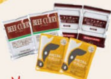
北海道レトルトセット 全国宅配夏ギフトカタログ P 6