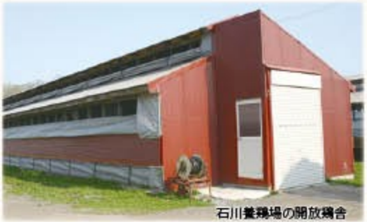
石川養鶏場の開放鶏舎