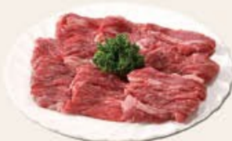
焼肉用(バラ) P 5 240g 1,090円(税込 1,177円)

「お肉ごろん 牛肉カレー」が仲間入り! 今まで以上に牛肉を楽しむことができるセットになりました♪ 単品の取り組みは P10 へ!