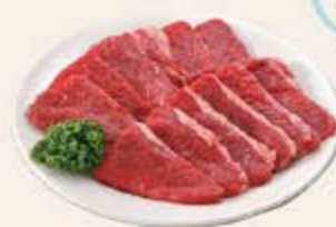
焼肉用(モモ) P 5 240g 1,260円(税込 1,361円)