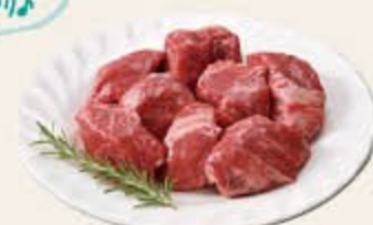
コロコロステーキ P 5 240g 1,905円(税込 2,057円)