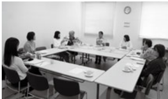
生活クラブ本部会議室 (3/9)

機関誌『チュプ』は、生活クラブ運動の理念や考え方を伝え、組合員活動に活用できる誌面をめざしています。組合員の声を誌面に活かすためにモニター制度があり、年に1回会議をおこなっています。