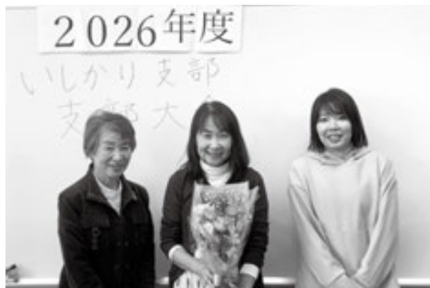
3/20 花川南コミュニティセンター

※支部運営委員会と連携して活動する機関紙の会議の一つ。組合員が集い、食(消費材)を中心とした交流や企画で、生活クラブ運動の意義を実感できる場