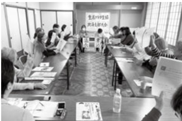
3/13 篠路コミュニティーセンター

組合員数 533 人に対し、書面議決書 190 人、実出席は 13 人でした。2025 年度の拡大は、くらコミメンバーと協力してチラシまき、あみーが運行、支部イベントなど活発に活動しましたが、目標を大きく下回ることに。反面、組合員向けのイベントはどれも好評で、利用結集に結びつきました。新規組合員には加入後 2 ヶ月にわたり、支部おすすめの消費材とアンケートをお届けし、支部とのつながりをつくることができました。出席者からは、拡大における新聞折り込み効果や決算への質問、意見がありました。