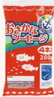
420 おさかなソーセージ 70g × 4本 420円(税込454円)

魚肉ソーセージは、市販品で「化学調味料や着色料が多く使われる食品」といわれています。生活クラブの「おさかなソーセージ」「おさかなソーセージミニ」は、組合員の「魚嫌いの子どもや家族に安心して食べさせられる、安全な(添加物を使用しない)魚肉ソーセージが食べたい!」という想いから開発された消費材です。