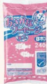
421 おさかなソーセージミニ 30g × 8本 428円(税込462円) p9