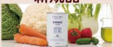
エキストラバージンオリーブオイル小 P5