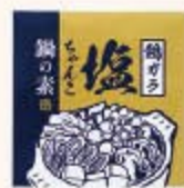
鶏ガラ塩ちゃんこ鍋の素 P7